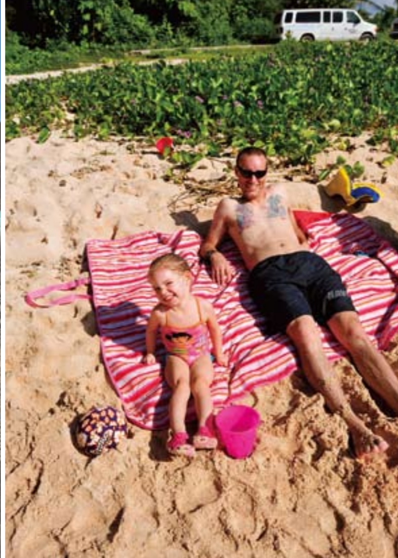
ホテル・ニッコー・グアムの北側に位置するガン・ビーチで、日光浴を楽しむ愉快的親子。