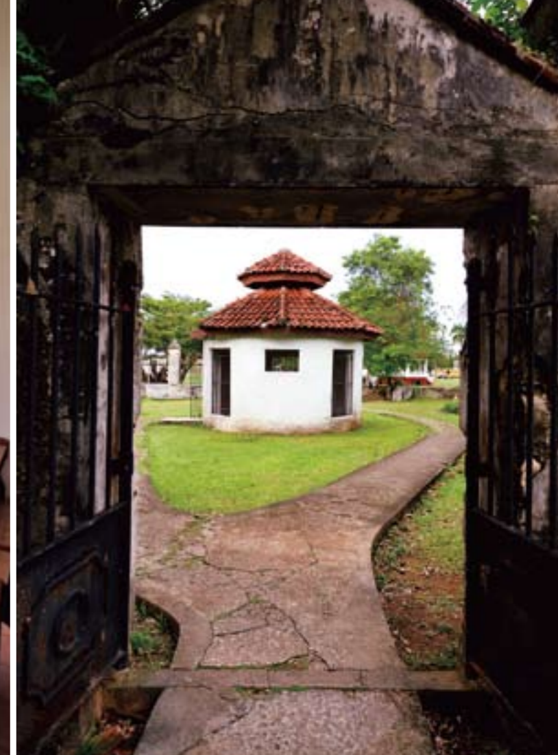
スペイン広場に残るスペイン総督邸の遺跡。円形の小さな建物は復元されたもので、チョコレートハウスと呼ばれる。

として立っている。その後 1565 年、スペインが領有を宣言して植民地化し、1668 年にグアムは正式にスペイン領となった。スペイン人の布教により現在もチャモロ人のほとんどは敬虔なカトリック教徒で、毎週日曜日には家族揃って教会に行く。ウマタック村の入り口では、1939 年、ローマ法王がこの地を訪れたことを記念して建てられたレモン色の聖ドニシオ