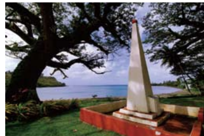
1521 年、ポルトガル人、マゼランが初めてグアムに上陸したウマタック湾の岸辺には、記念碑が立っている。

として立っている。その後 1565 年、スペインが領有を宣言して植民地化し、1668 年にグアムは正式にスペイン領となった。スペイン人の布教により現在もチャモロ人のほとんどは敬虔なカトリック教徒で、毎週日曜日には家族揃って教会に行く。ウマタック村の入り口では、1939 年、ローマ法王がこの地を訪れたことを記念して建てられたレモン色の聖ドニシオ