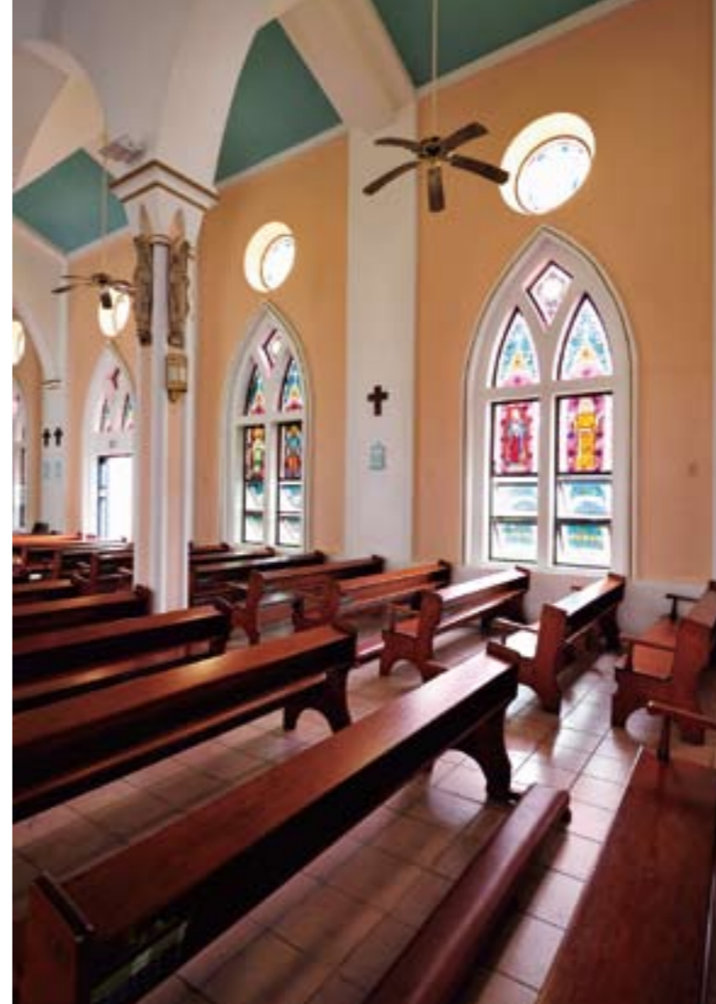
スペインの三代目総督、キロによって開かれたイナラハンの村にある聖ヨセフ教会。

スペイン統治下の文化が残っている村を訪れようと、タモン湾から車で南へと向かう。途中、セラ湾展望台からラムラム山を眺めてみた。このあたりまで来ると、隆起サンゴの石灰岩でできている北部と異なり、水が豊富で緑が一際濃くなる。しばらく走って南端近くのウマタック湾に到着。1521 年、ポルトガル人探検家、マゼランが初めてグアムに上陸したのはこのウマタック村だった。三角の白い石碑が上陸地の目印