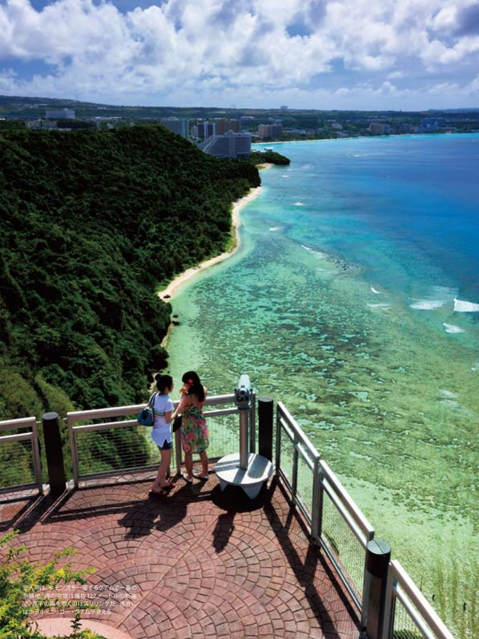
恋人岬は、タモン湾を一望するグアムで一番の景勝地。岬の突端は海拔122メートルの断崖で、真下の海を覗くのはスリリングだ。遠方にはホテル・ニコニー・グアムが見える。