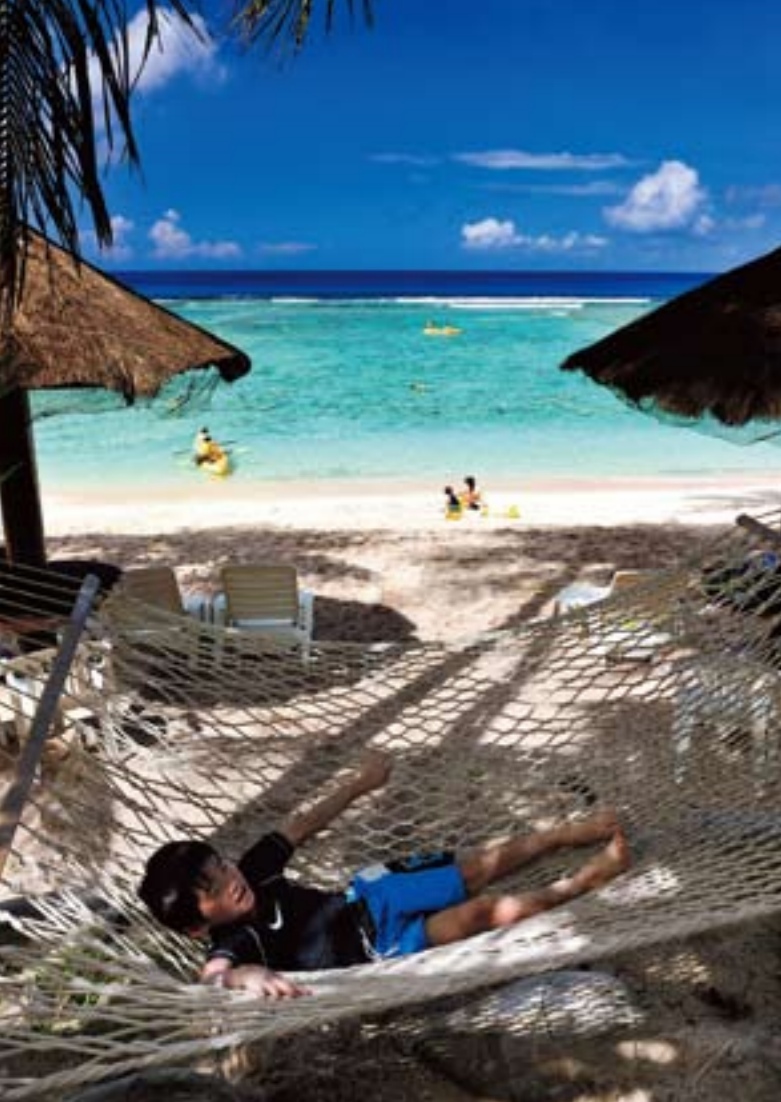
島の北西部にあるココパーム・ガーデンビーチの静かな海辺では、大人も子供も一日中リラックス。